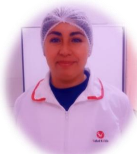
MACARENA MIRANDA MANIPULADORA